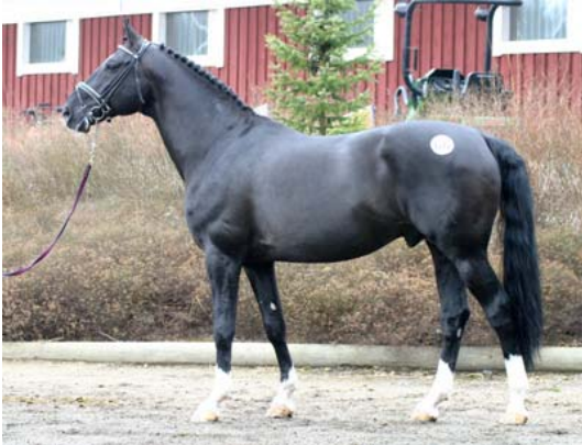
Kuva: ori Angard