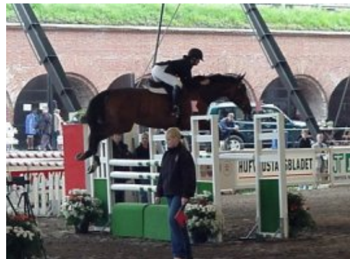
kuva: Bastionin kilpailukenttä

Lisätietoja kilpailusta http://www.csiohelsinki.com/bastioni