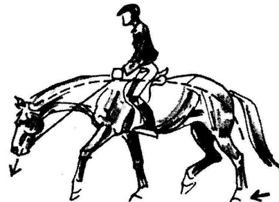
Kuva1. Kun hevonen kulkee pyöreästi, se kantaa ratsastajansa tasapainossa. Kuvassa hevonen ratsastettu eteen alas kuten esim tehdään alkuverryttelyssä.

Näinpä pikkuhiljaa yritetään oppia ratsastamaan hevonen oikein päin eli kulkemaan perään annossa. Tällöin se kantaa itsensä ja ratsastajan oikein, sen liikkeet tuntuvat mukavemmilta ratsastajalle sekä hevonen itse säilyy terveempänä sen lihaksiston toimiessa oikein.