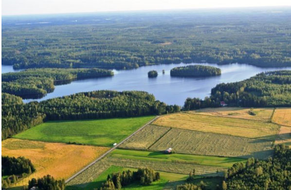
Kuva: Suomalainen maaseutu on silmiä hivelevää.

Yhdessä viikkasimme pallon sen säilytyspussiin joka oli perässämme ajaneessa huoltoautossa. Se oli samanlaista kuin ylisuurta makuupussia tunkisi pussiin joka on aina liian pieni. Alkuun tuntui mahdottomalta, että se mitenkään voisi mahtua sinne.