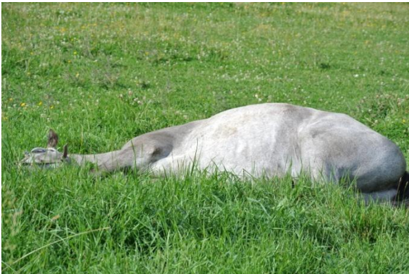
Kuva: Äh, eiku pää tyynyyn..

Nikke on sujuvasti siirtynyt töihin kokeneempien ratsastajiemme käyttöön, kiitos Hetalle hyvin tehdystä ratsutuksesta.