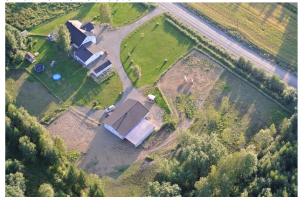
Kuva: lensimme pienen hevostallin yli, hevoset olivat levottomia mutta lentäjä ei käyttänyt kohisevaa poltinta niiden yläpuolella, joten ne pysyivät nahoissaan.

Kuumailmapallo nousi nopeasti ja tasaisesti ylös kuin olisi hississä ollut. Äkkiä olimme 300 metriä korkealla ja talot sekä autot näyttivät lasten leluilta. Pallo menee minne tuuli kuljettaa ja koska se kulkee tuulen mukana, niin korissa ei tunne tuulta. Ilma oli kaunis ja aurinkoinen joten siellä tuli melkoisen lämmin polttimen hohkaessa lisälämpöä myös alaspäin. Äidin mukaan tunkemat hupparit olivat ihan turhaa lastia.