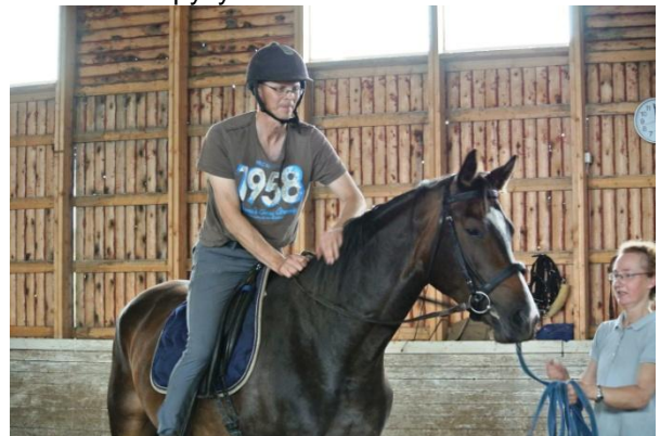
Kuva 1: Ensimmäistä kertaa selässä. Toinen käsi pitää harjasta kiinni jos Syrri päättääkin pompata jonnekin ja toinen silittelee hevosta. Ilmeistä näkee että sekä hevonen että ratsastaja ovat hieman varautuneita. Selässä istutaan vielä kevyesti.

Olemme kuitenkin aina tehneet sen itse. Mutta tällä iällä ei halua ottaa mitään riskiä, joten alkutyö vie useampia päiviä. Selkään kiipeämme kun olemme mahdollisimman varmoja hevosen luottamuksesta. Silti aina on se mahdollisuus, että hevonen saa hepulin, eikä silloinkaan saisi pelästyttää hevosta ja selässä tulisi pysyä kiskomatta suusta.