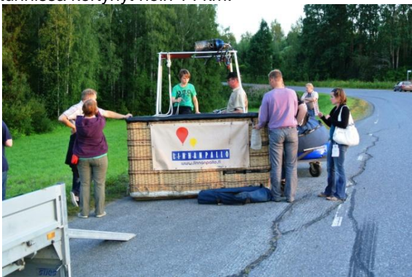
Kuva: Korja puretaan lennon jälkeen tienposkessa illan hiljaa hämärtyessä.

Kun pallo oli pakattu ja kori nostettu peräkärkyyn, korkkasimme shamppanjat ja saimme lentodiplomit. Kuumailmapallojennoilla kuulemma juodaan aina shamppanjaa jos on ensikertalaisia mukana ja jos ei ole, joku määrätään sellaiseksi. Jullea varten oli varattu AkuAnkka-limpsaa. Lopuksi kaikki seitsemän matkustajaa, lentäjä ja avustaja sullouduimme maasturiin ja ajoimme takaisin lähtöpaikalle. Linnuntietä matkaa oli tunnissa kertynyt noin 14 km.