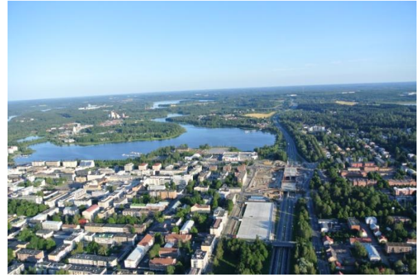
Kuva: heti noustuamme saimme ihailua Hämeenlinnan kaupunkia

Hieman muutamien kasvot venähtivät totiseksi kun lentäjämme lähetti testipallon ilmaan. Normaali vappupallo singahti taivaalle ja katosi silmäkantamattomiin sekunneissa, noinko meidänkin nousu kävisi?