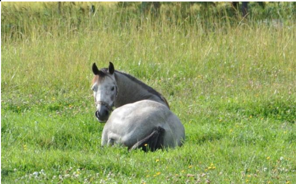
Kuva: Nikke nauttii kesästä.. mitä se Julle häiri kameran kanssa

Myös muilla tunneilla harjoitellaan pieniä esteitä ja puomitehtäviä silloin tällöin.