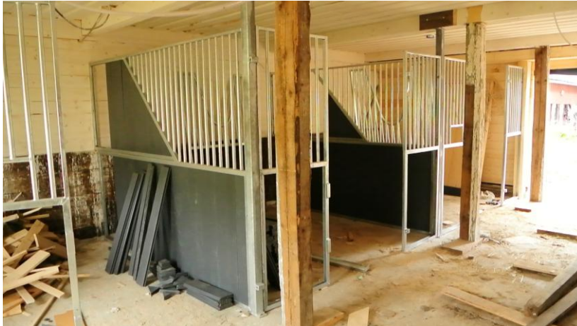
Kuva: karsinaelementit paikoillaan, kuvassa näkyvät puutolpat poistuvat. Karsinoiden seinäin tulee paksua muovilankkua joka kestää aikaa, likaa ja hevosta. Väliseinät osin umpinaiset, jotta hevosilla on halutessaan omaa rauhaa.

Eri asia vain on, koska he seuraavan kerran ehtivät tänne, koska samaan aikaan on useampia talliprojekteja käynnissä ja isompi Poni-Haka Vantaalla ajaa meidän työmaastamme ohi. Voi olla että tälle kesälle ajateltu ison tallin karsinoiden uusiminen jää ensi kesään, koska laidunkausi loppuu vääjäämättä ennen kuin siihen päästään käsiksi.