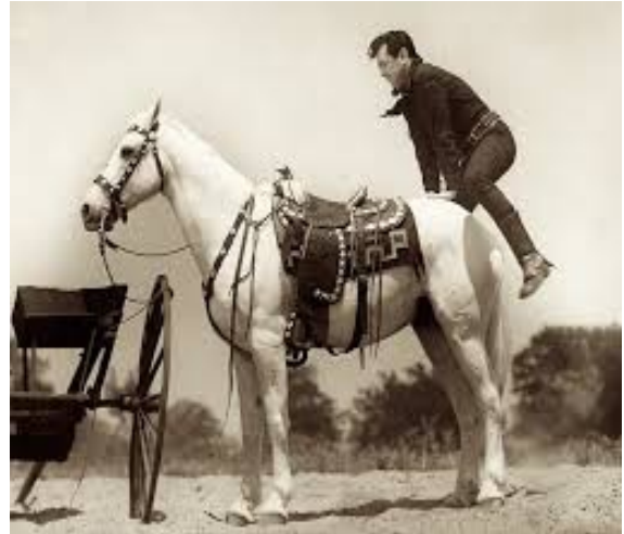
Kuva: näinkin voi yrittää mutta ei suositella