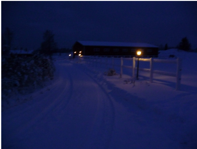
Kuva: näinkin jouluisia on ollut tänä syksynä tosin vain väärään aikaan, kuva otettu marraskuussa aamulla hevosten uloslaiton jälkeen

Maksu samalle tilille kuin ennenkin, 1.erä 23.1. mennessä ja toinen erä 3.4. mennessä.