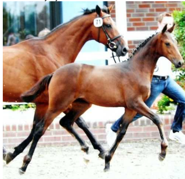
Kuva: Pasadena näyttelyssä Saksassa emänsä kanssa

Juuri kun olimme tehneet vakaan päätöksen, että vähään aikaan ei meille uusia hevosia tule, niin eikös me menty ja ostimme 2-vuotiaan nuoren Saksassa syntyneen kaunottaren.