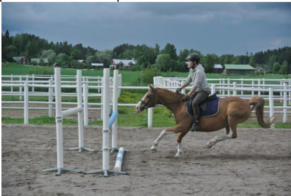
Kuva 1. Viimeisellä askeleella poni päättää lyödä jarrut pohjaan ja on juuri juntaamassa takajalat ponnistuksen sijasta maahan

Hyvä istunta on tärkeä, sen osoittaa tämä kuvasarja. Thielo-poni toteaa juuri ennen ponnistusta olevansa hieman liian kaukana esteestä ja päättääkin yllättäen lyödä jarrut pohjaan. Kielto on tälle ponille harvinaista, joten ratsastaja ei sitä osannut odottaa. Ilman oikeaa istuntaa olisi ratsastaja löytänyt itsensä toiselta puolen estettä ilman ponia.