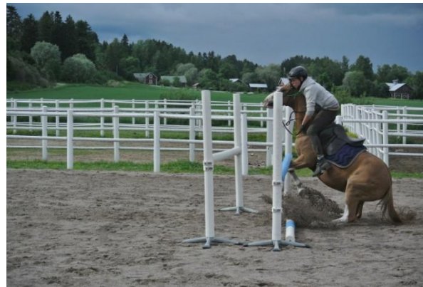
Kuva 3: poni väistää estettä ja kääntyy takajalkojensa päällä, ratsastaja ottaa tukea hevosen kaulasta saaden vähäisenä vauriona yhden vääntyneen sormen