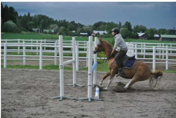
Kuva 2: liukujarrutus joka kelpaisi westernissäkin, ratsastaja säilyy tasapainossa