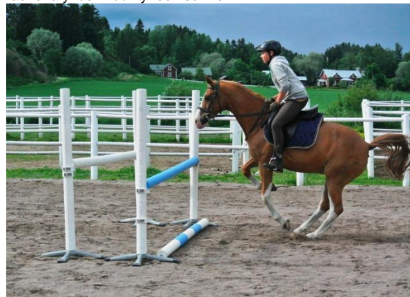
Kuva 4: uusintayrityksellä taas rohkeasti hyppyyn, ratsastajan katse hienosti koko ajan eteenpäin joka kuvassa

Kesäkuu on näin tullut kalkkiviivoilleen, kesää on silti paljon jäljellä. Nautitaan siitä nyt jotta on mitä muistella kun talvella hytistään ja kaivataan helteessä hikoilua, pään ympärillä pörrääviä paarmoja ja kärpäsiä, ojanpenkalla lymyileviä kyykäärmeitä, jatkuvaa nurmikon leikkuuta, yöllä valvottavaa hyttysten ininää..