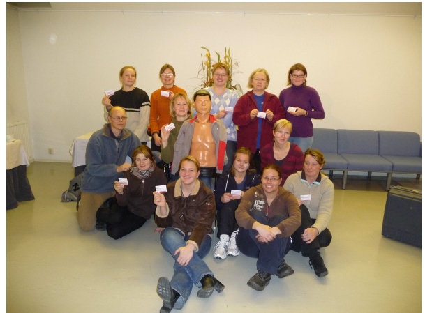
Kuva: kurssi suoritettu ja uudet kortit saatu

Nykyinen turvallisuusajattelu edellyttää kurssin käymistä yleisölle palveluita tarjoavalta yritykseltä.