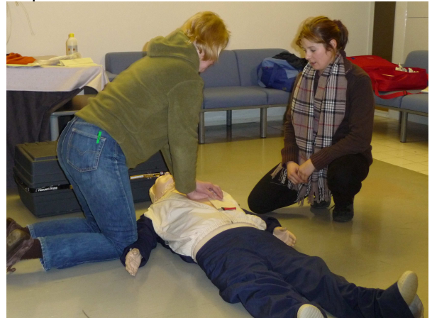
Kuva: 30:2 paineluelytys menossa (30 painallusta ja 2 puhallusta, on raskasta ja hiki tulee parissa minuutissa)

II-kurssi edellyttää peruskurssin käymistä ja keskittyy paljon enemmän harjoitteluun ja tilanteiden ratkaisuun. Tavoitteena toimia oikein ja varsinkin oikeassa järjestyksessä silloin kun hätä on päällä.