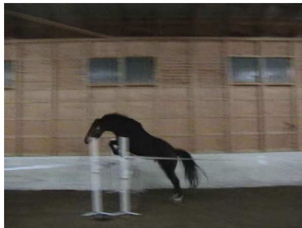
Kuva: Viksu ponnistaa okserille hyvällä tekniikalla

Nuorten hevosten ja varsojen irtohypyttäminen pari kertaa kuussa kuuluu niiden opetussuunnitelmaan ja tehdään meillä usein lauantai-iltaisain kun muissa perheissä katsotaan telkkaria.